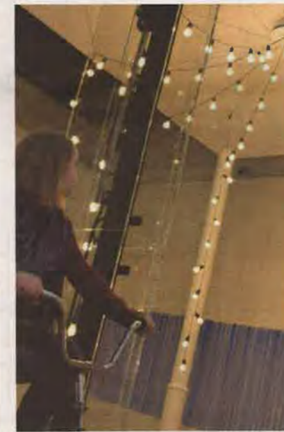
PRØV SELV: «Light pavillion» inviterer deg til å forme verket selv.