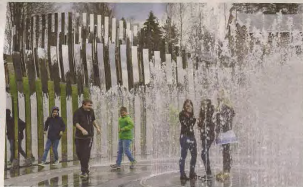
GLEDE, REFLEKSJON OG FULL FORVIRRING: Er verket i naturen eller er naturen i verket? «Path of silence» gir både forundring og en indre sanselig opplevelse.