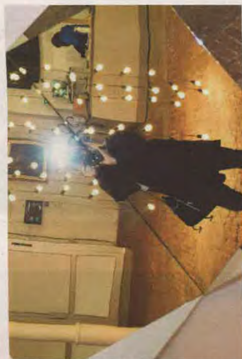
360 DEGREES ILLUSJON: Fort gjort å bli litt uvel hvis du står lenge ved denne.